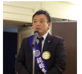
【生方ガバナーと記念撮影】