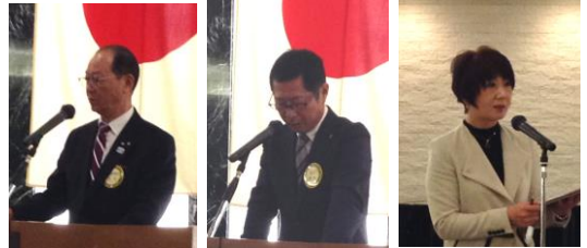
2017年1月23日 例会 例会出席率表