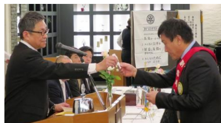
会員増強バッジ授与