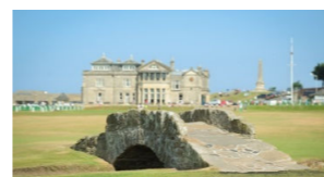
世界のゴルフ場 100選 セントアンドリュース オールドコース(スコットランド)