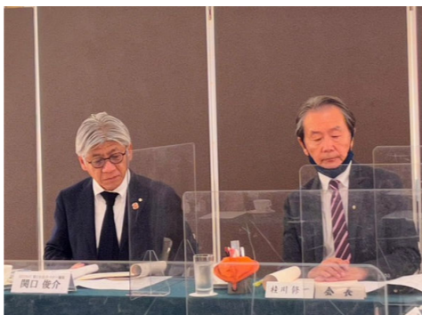
関口ガバナー補佐(左) 桂川会長(右)