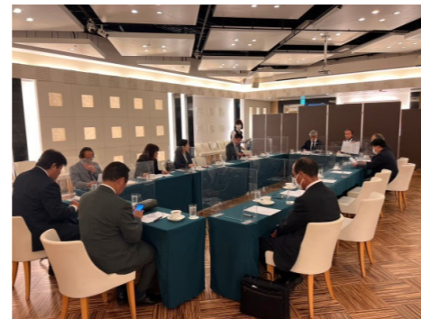
クラブ協議会の様子