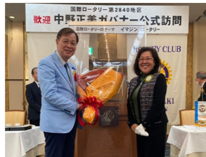
中野ガバナーに花束贈呈