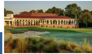
世界のゴルフ場 100選 パインハーストリゾート No.2(アメリカ)

ノースカロライナ州、パインハーストリゾートは全部で8のコースがあり、世界では中国のミッシェンヒルズGCに次いで2番目、全米最大のゴルフコース。 高崎ロータリークラブ[第2840地区] 創立/1954年3月30日 例会日/毎週月曜日 12:10 ~ 13:10 例会場/ホテルグランビュウ高崎 事務局/ホテルグランビュウ高崎