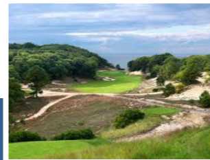
世界のゴルフ場 100選 フライアーズ・ヘッド(アメリカ・ニューヨーク州)

アメリカ合衆国、 ニューヨーク州。ロン グアイランド湾に面 する自然の起伏を 活かしたネオ・クラ シックコースでリンク ス風の趣もある。