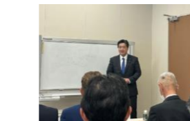
昼食時、参議院議員の清水真人氏が挨拶に来て頂きました。