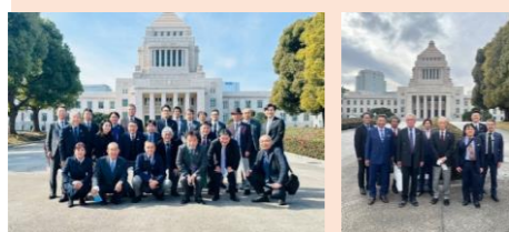
A班 集合写真 (25名)

→「参観ロビー」の有無、国会議事堂の模型があったり議員席のレプリカもあったり展示が充実しています。