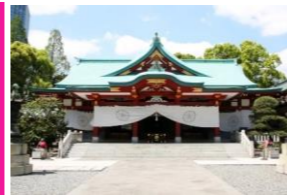
一度は行ってみたい日本神社100選めぐり 日枝神社：東京都千代田区永田町2丁目10-5