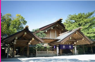
一度は行ってみたい日本神社100選めぐり 熱田神宮：愛知県名古屋市熱田区神宮1丁目1-1