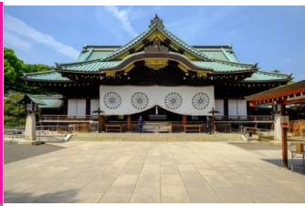
一度は行ってみたい日本神社100選めぐり 靖國神社：東京都台東区浅草2丁目3-1